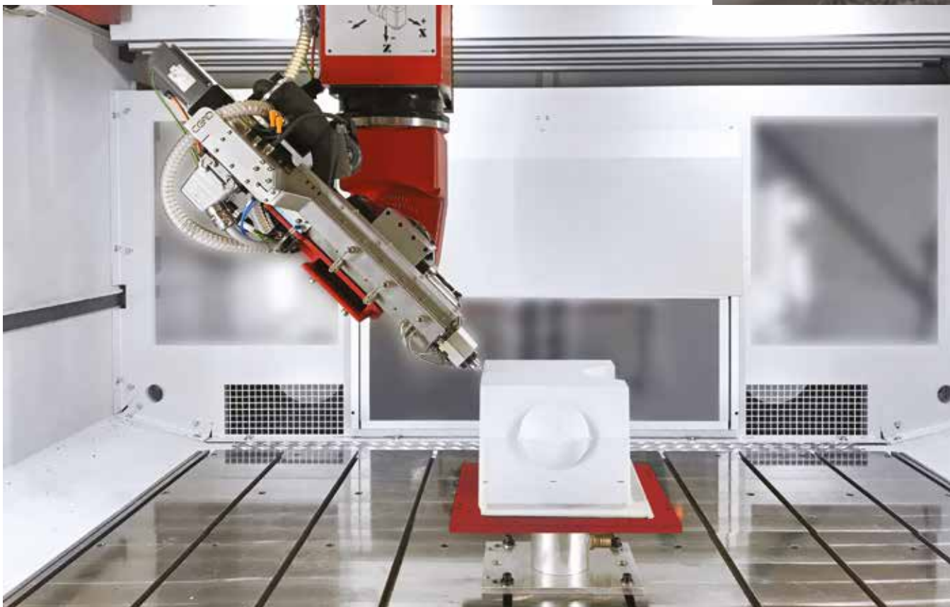
45 Grad Extruderausrichtung und Druck